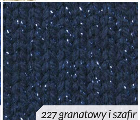
227 granatowy i szafir