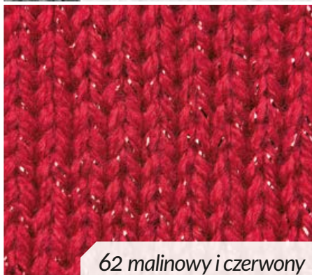
62 malinowy i czerwony