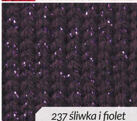
237 śliwka i fiolet