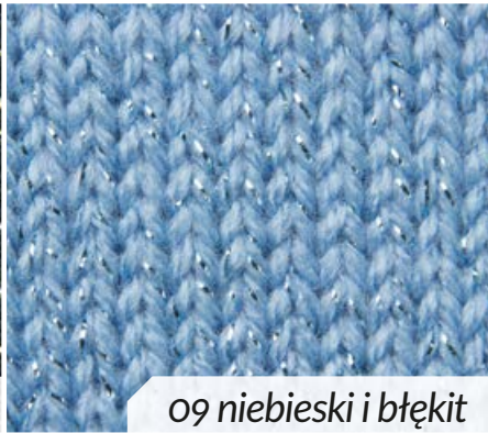
09 niebieski i błękit