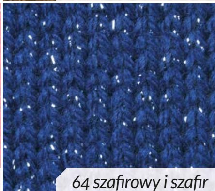
64 szafirowy i szafir