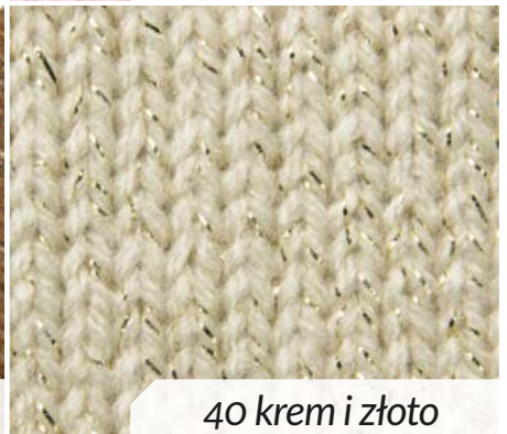
40 krem i złoty