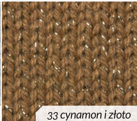
33 cynamon i złoty