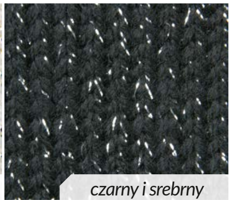
czarny i srebrny