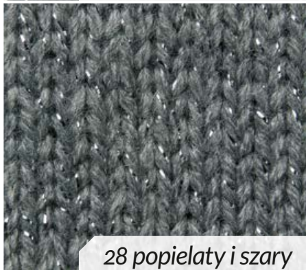
28 popielaty i szary