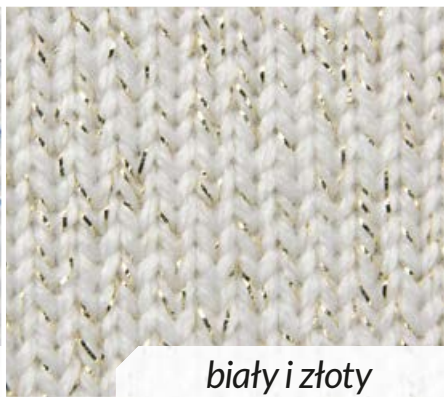
biały i złoty