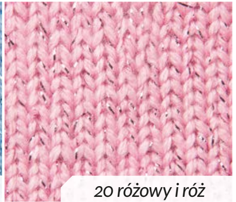
20 różowy i róż