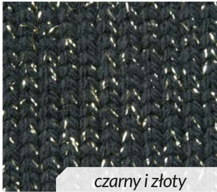
czarny i złoty