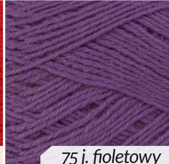
75 j. fioletowy