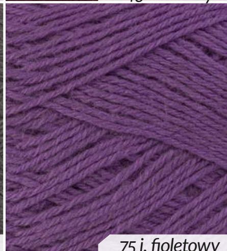
75 j. fioletowy