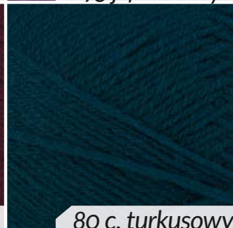
80 c. turkusowy