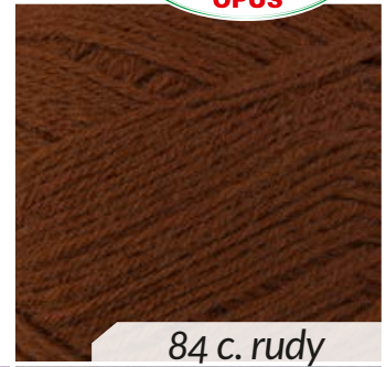
84 c. rudy