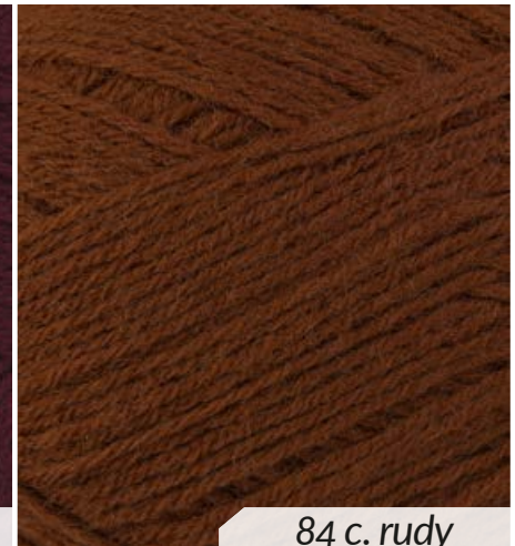
84 c. rudy