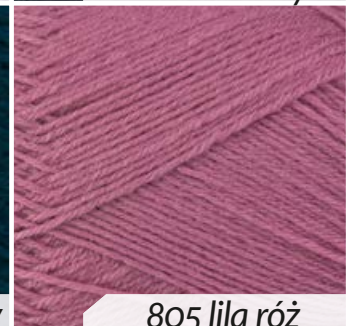
805 lila róż