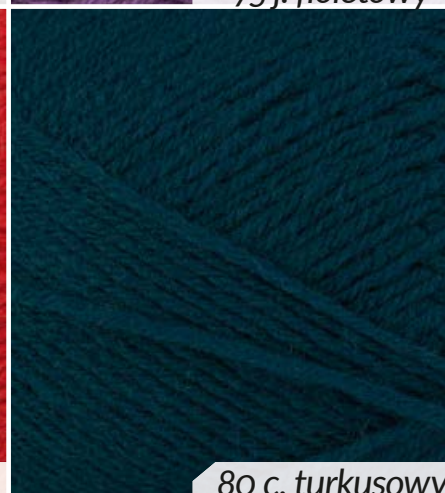
80 c. turkusowy