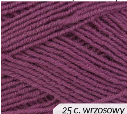
25 c. wrzosowy