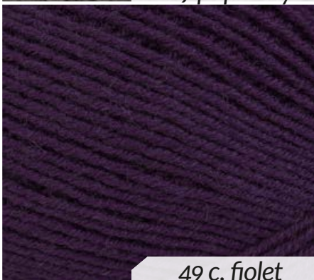
49 c. fiolet