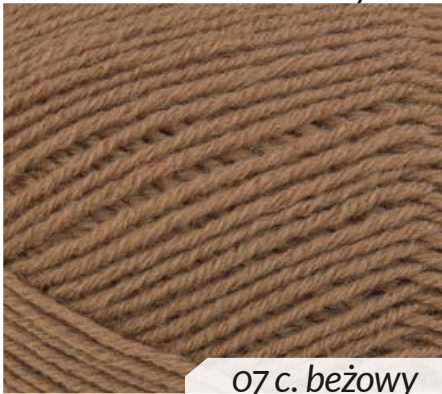
07 c. beżowy