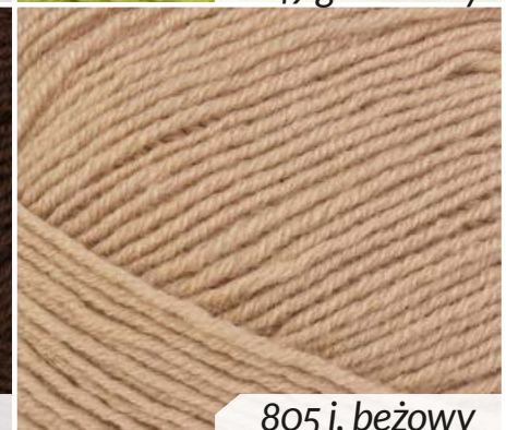
805 j. beżowy

Włóczka Opus Adel 100 g / 330 m, 55% wełna, 35% akryl, 10% kaszmir