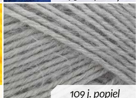
109 j. popiel