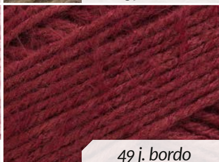
49 j. bordo