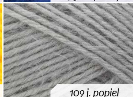
109 j. popiel

Włóczka La Passion Pansy 100 g / 270 m: 75% akryl, 25% poliamid