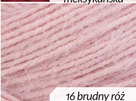
16 brudny róż