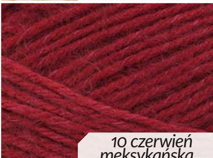
10 czerwień meksykańska