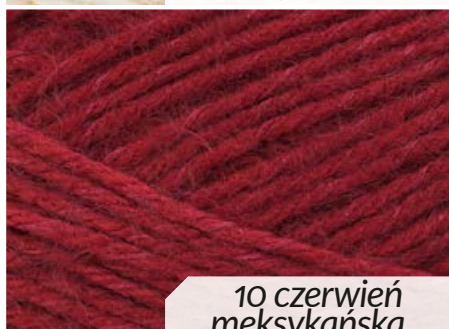
10 czerwień meksykańska