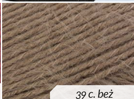
39 c. beż