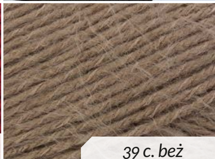
39 c. beż