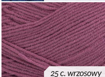
25 c. wrzosowy