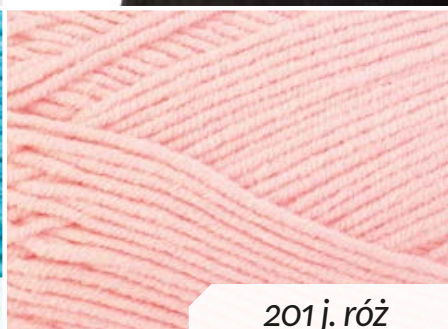
201 j. róż