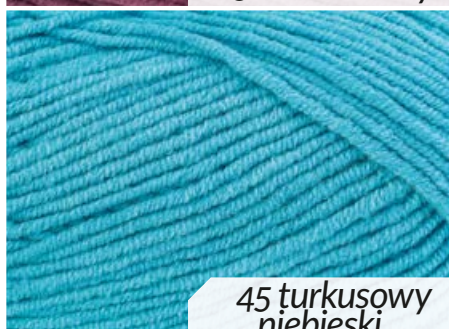
45 turkusowy niebieski