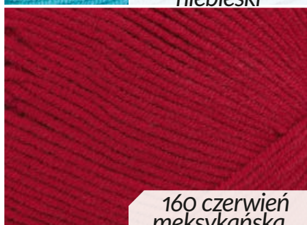
160 czerwien meksykańska