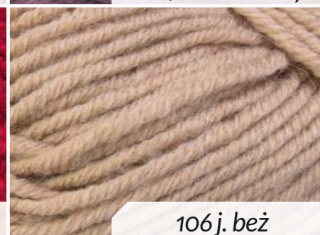
106 j. beż