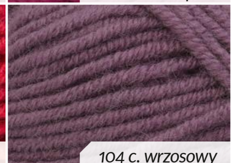
104 c. wrzosowy