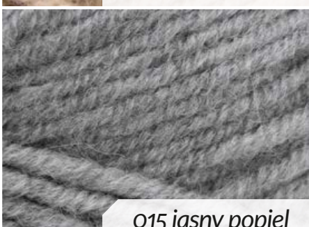
015 jasny popiel