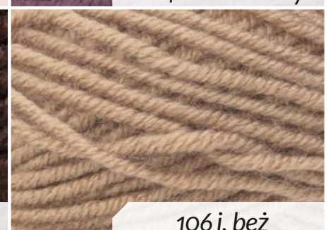
106 j. beż