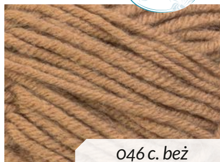
046 c. beż