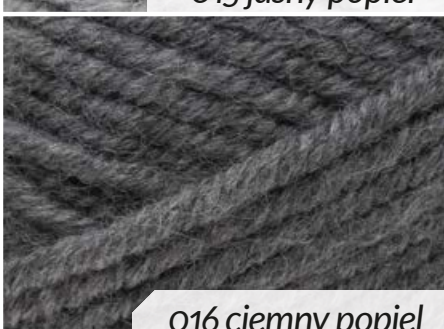
016 ciemny popiel