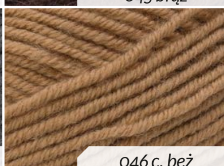
046 c. beż