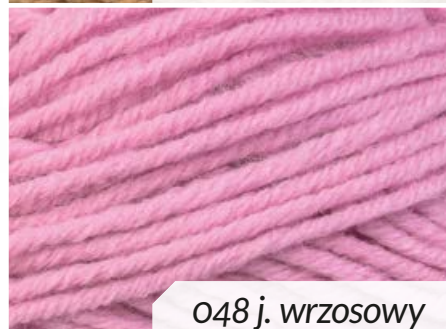
048 j. wrzosowy