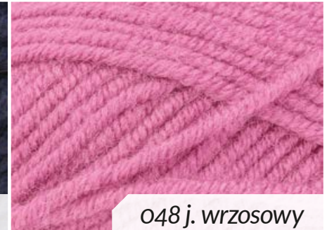
048 j. wrzosowy