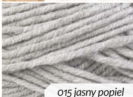
015 jasny popiel