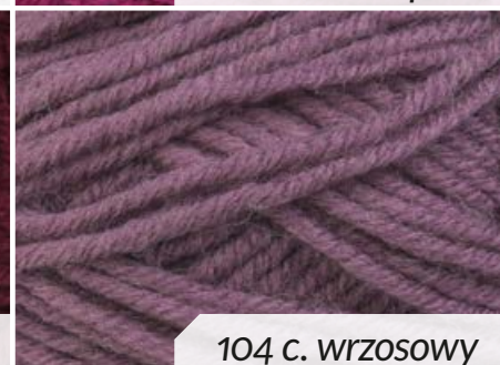
104 c. wrzosowy