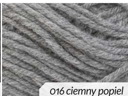
016 ciemny popiel