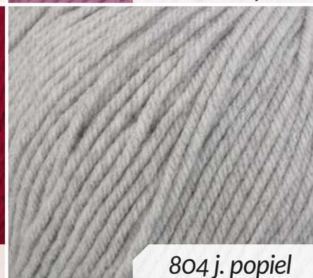
804 j. popiel