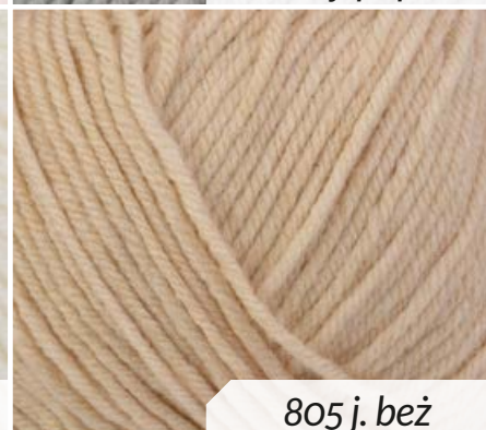
805 j. beż

Włóczka La Passion Daisy 50 g – 171 m: 70% mikrofibra, 30% poliamid