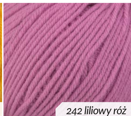
242 liliowy róż