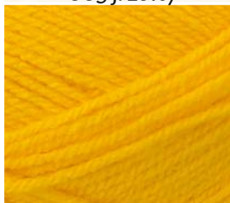
006 c. żółty