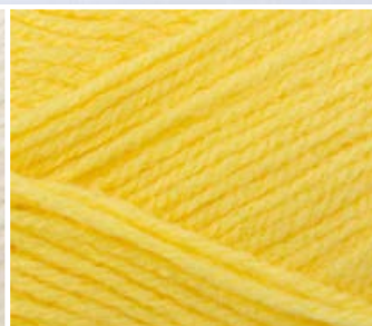
005 j. żółty