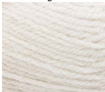
004 c. écru