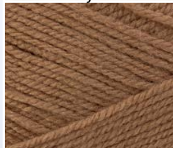
012 c. beż