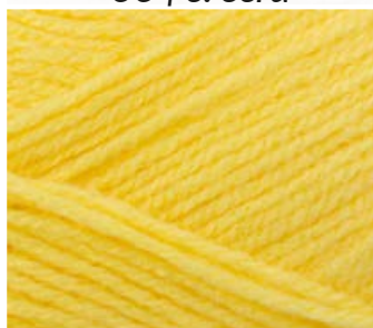
005 j. żółty