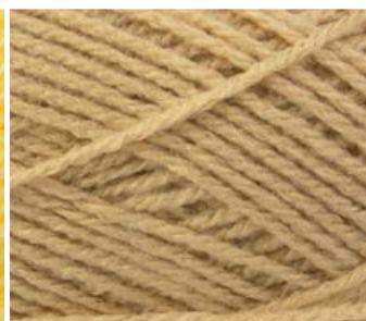
011 j. beż