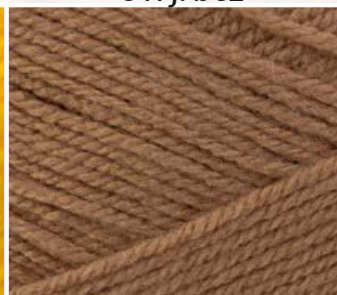
012 c. beż