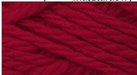
20002 czerwień meksykańska