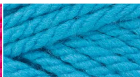
38750 jasny turkus