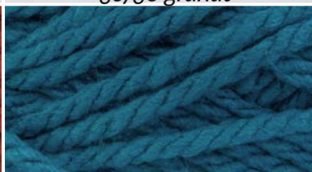
37340 błękit turkusowy