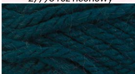
31870 zieleń turkusowa