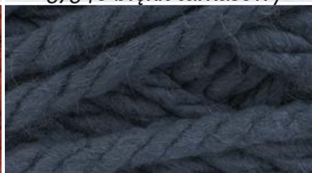
37530 c. stalowy