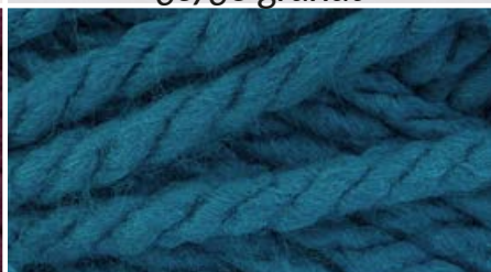
37340 błękit turkusowy