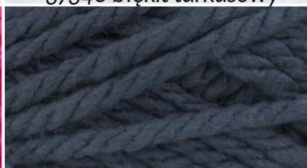
37530 c. stalowy