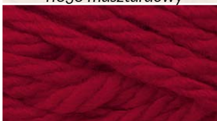
20002 czerwień meksykańska