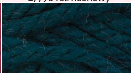
31870 zieleń turkusowa