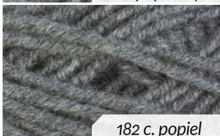
182 c. popiel