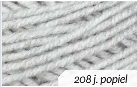
208 j. popiel