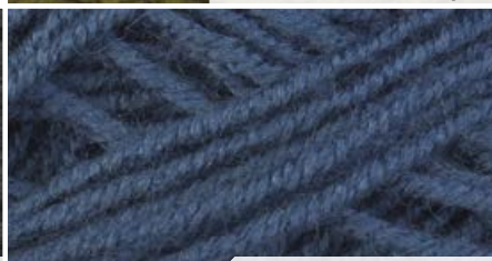
215 j. granat