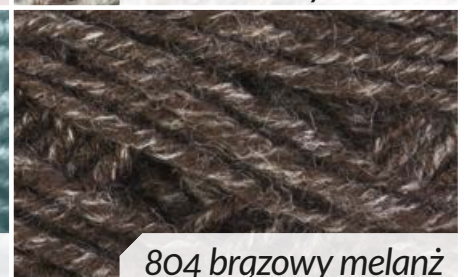
804 brązowy melanz