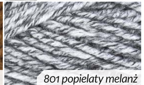
801 popielaty melanz