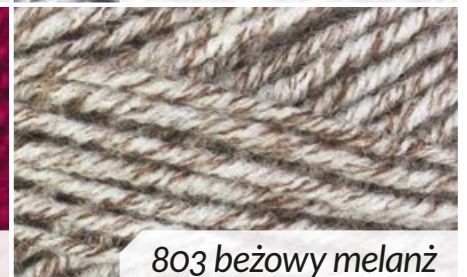
803 beżowy melanz