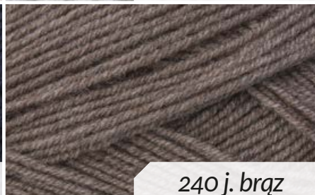
240 j. brąz