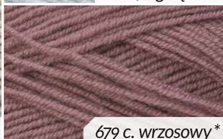
679 c. wrzosowy*