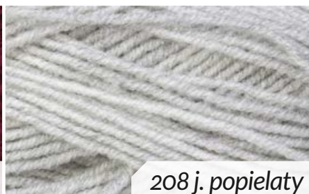
208 j. popielaty