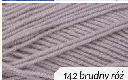
142 brudny róż