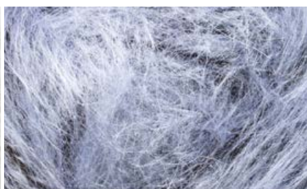
51-60 popiel / czarny