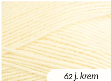
62 j. krem