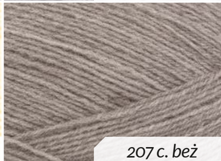
207 c. beż