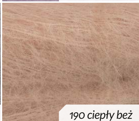
190 ciepły beż