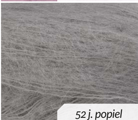
52 j. popiel