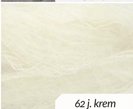
62 j. krem