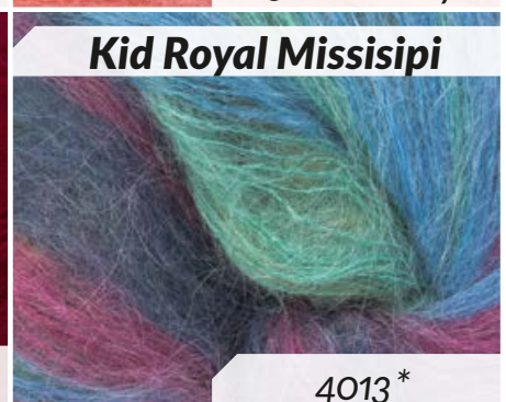
Kid Royal Mississippi