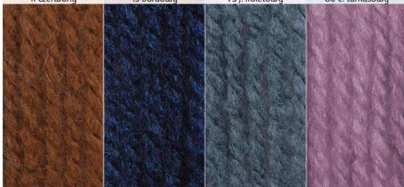
84 c. rudy