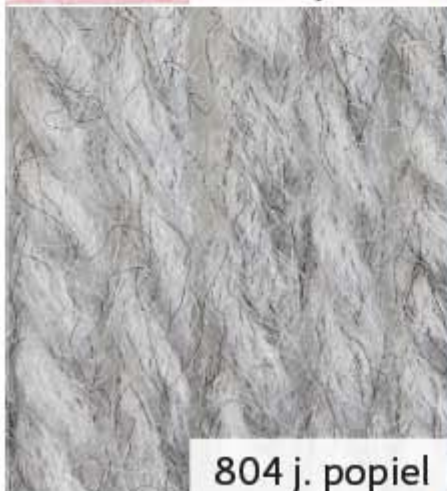
804 j. popiel