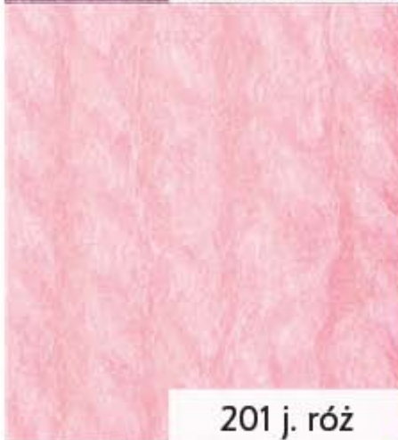
201 j. róż