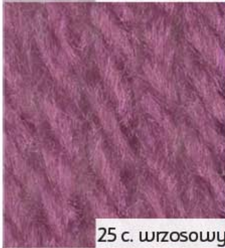
25 c. wrzosowy