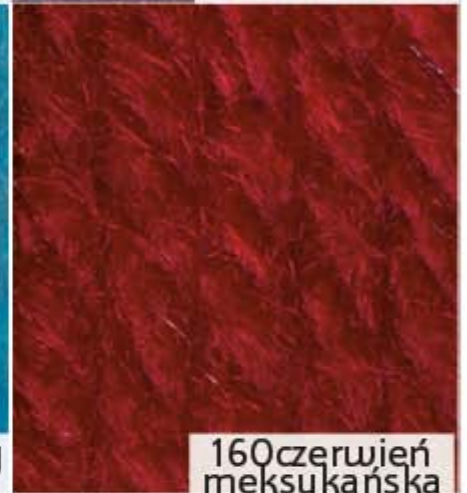
160 czerwień meksykańska