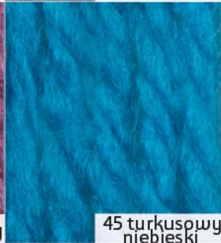
45 turkusowy niebieski