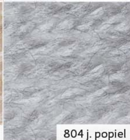
804 j. popiel