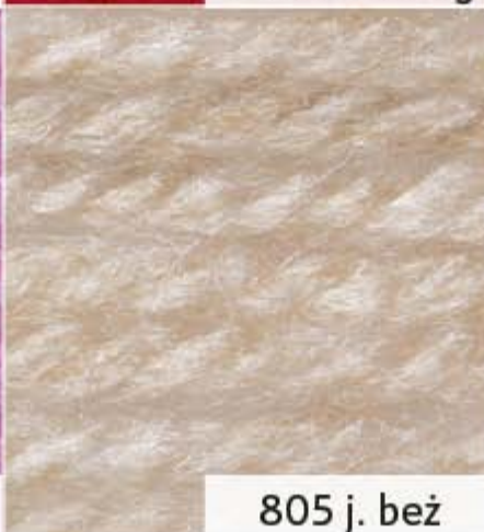
805 j. beż