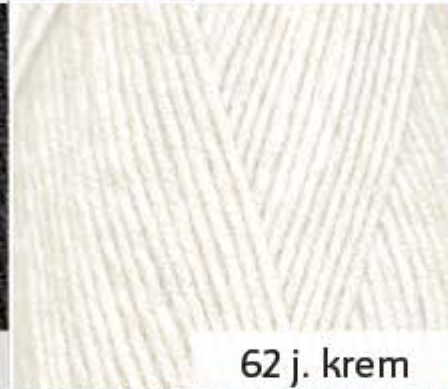
62 j. krem