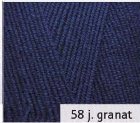
58 j. granat