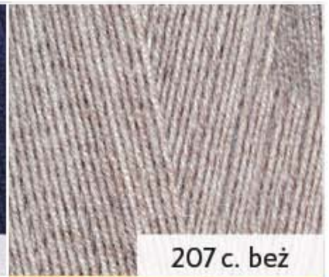
207 c. beż