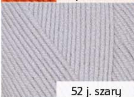
52 j. szary