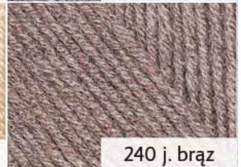
240 j. brąz