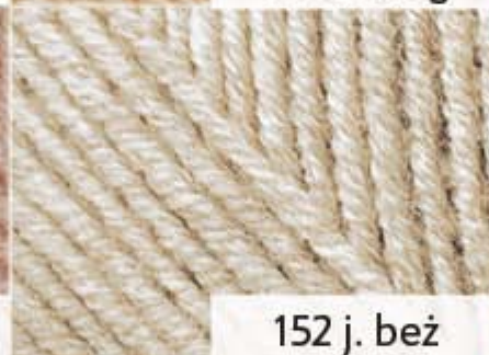
152 j. beż