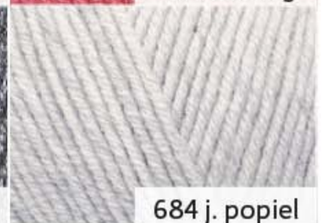
684 j. popiel